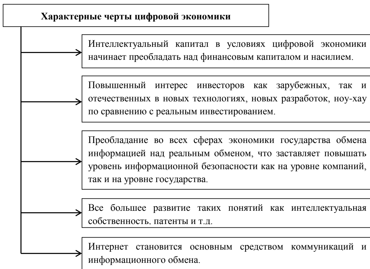
Рис. 3. Характерные черты цифровой экономики.

О.А. Луговкина отмечает 56 , что институциональные отношения трансформируются благодаря цифровизации, базирующейся на технологических решениях. Исследователем выделены характерные черты цифровой экономики (рис. 3).