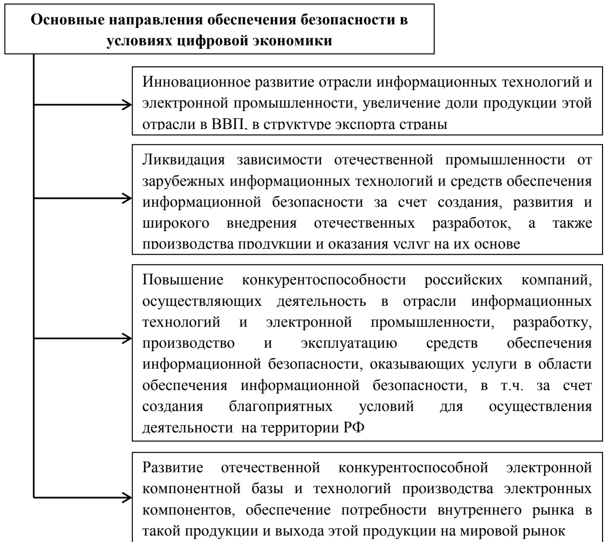
Рис. 4. Основные направления обеспечения экономической безопасности в условиях развития цифровой экономики.

Национальная программа «Цифровая экономика Российской Федерации» включает в себя 6 федеральных проектов: «Нормативное регулирование цифровой среды», «Кадры для цифровой экономики», «Информационная инфраструктура», «Информационная безопасность», «Цифровые технологии», «Цифровое государственное управление».