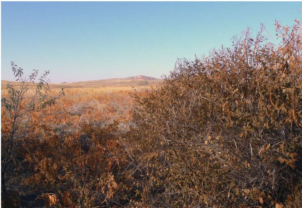
Рисунок 3 — Эндемик Богдинско-Баскунчакского солянокупольного района поацинум Казакевича ( Poa cynum kazakevichchii E. Mavrodiev, A. Laktionov & Yu. Alexeev) (справа) в урочище Шарбулак ( locus classicus ). На заднем плане — южный и юго-восточный склоны г. Б. Богдо

В категорию L мы включили виды растений, которые были описаны на территории Богдинско-Баскунчакского солянокупольного района — своего классического местонахождения ( locus classicus ). В категорию L включены виды растений, имеющие как широкий ареал, так и узколокальные эндемики. Например наиболее интересным и своеобразным представителем категории L является эндемик Богдинско-Баскунчакского солянокупольного района поацинум Казакевича ( Poa cynum kazakevichchii E. Mavrodiev, A. Laktionov & Yu. Alexeev), весь ареал которого занимает небольшое понижение среди хвалынских песчаных массивов и выходов карста на дневную поверхность в урочище Шарбулак (рис. 3) [23].